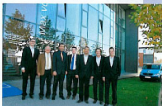
Sie sorgten für Innovationen und Informationen aus erster Hand.

Rund 30 Experten und Gäste kamen nach Augsburg, um über die angesprochenen Problematiken zu informieren und beraten. Zu den Referenten des Symposiums zählten namhafte Wissenschaftler, Diplom-Ingenieure und Fachleute, die in halbständigen Vorträgen über neueste Erkenntnisse und Vorschriften zum Thema Raumtechnik und Gesundheit, Hygieneklimaanlagen in Operationssäle sowie neue Verpflichtungen für Architekten und Planer informierten. Nach dem theoretischen Teil