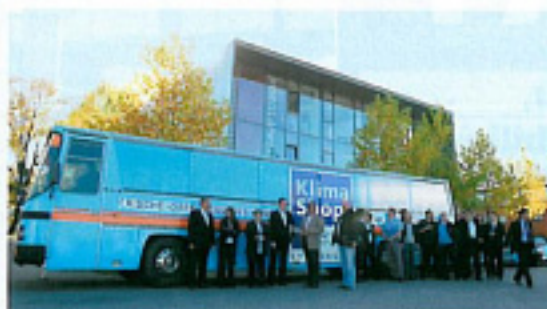
Mit dem KlimaShop!-Bus ging's nach dem Symposium zur Klima-Tour durch Augsburg.

Max-von-Laue-Straße 5 D-86156 Augsburg Tel. 0821/7 49 66-0 Eversbuscherstraße 3 D-80999 München Tel. 089/21 02 49-12