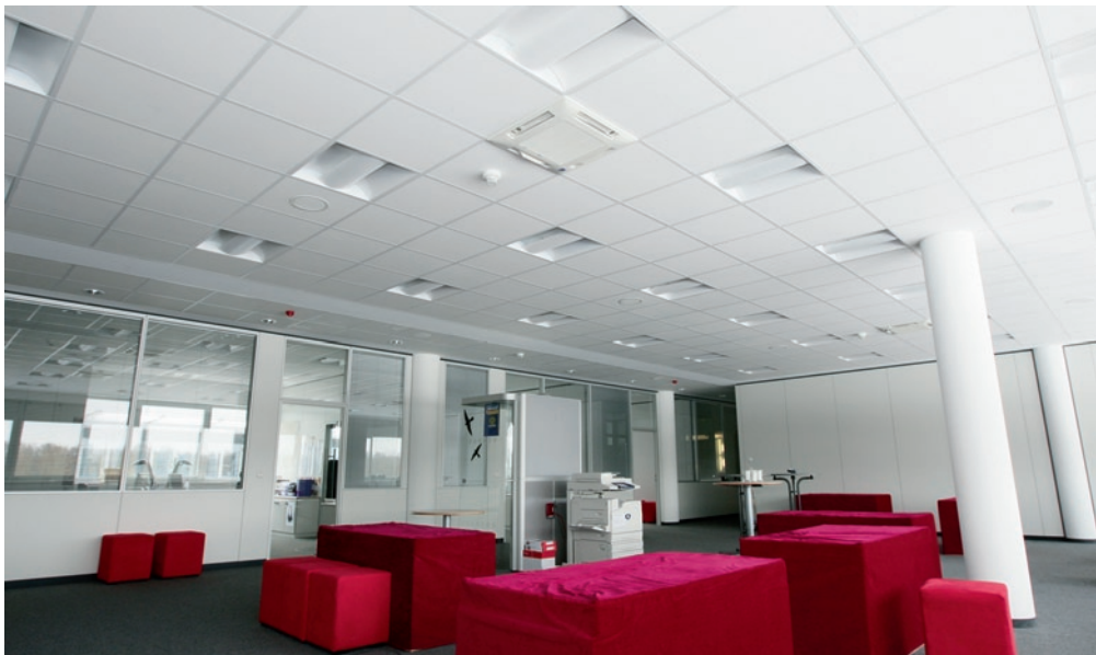
Abb. 5: Zur Klimatisierung der Komfortbereiche im Antenne Bayern-Gebäude werden Deckenkassettengeräte eingesetzt.

Die gesamte Anlage wird zentral gesteuert. Prüfung und Regelung erfolgen komplett über das Gebäudemanagementsystem. Von hier aus haben die Verantwortlichen Zugriff auf jede Einzelanlage, um im Bedarfsfall von der Temperatur über die Stärke des Zuluftstroms bis hin zum Lamellenstand der Deckenkassettengeräte jede Anlage einzeln zu regulieren. Maximalen Komfort genießen die Mitarbeiterinnen und Mitarbeiter außerdem aufgrund der Möglichkeit, zu jeder Zeit in jedem Studio oder Büro ihr individuelles Wohlfühlklima zu schaffen.