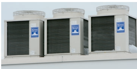
Abb. 2: Drei VRF-Außengeräte wurden auf dem Gebäudedach installiert. Im Endausbau sind 12 Außeneinheiten mit einer thermischen Leistung von insgesamt 510 kW vorgesehen.

Die Anforderungen an die Erweiterung des bereits vorhandenen Klimasystems waren aufgrund der speziellen Rahmenbedingungen entsprechend hoch. Die Studios des modernen Medienunternehmens sind mit hoch sensibler Sendetechnik ausgestattet. Diese ist bereits ab Außentemperaturen von 27 °C und mehr vom Ausfall bedroht. Neben einem leistungsfähigen Klimasystem gehörten maximale Sicherheit, Energieersparnis und Umweltfreundlichkeit