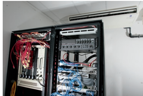
Abb. 3: Die Kühlung der kleinen Serverräume erfolgt über 2 Deckengeräte mit Kälteleistungen von je 12 kW.

sowie minimale Geräuschemissionen im Studiobetrieb zum Anforderungsprofil der Anlagenerweiterung.