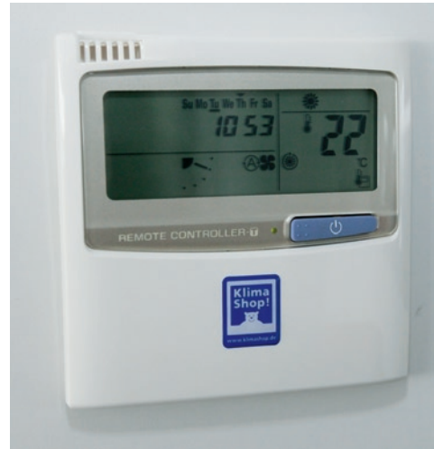
Abb. 6: Über Raumregler können die Mitarbeiter die Wunschttemperatur in ihrer Zone individuell einstellen.