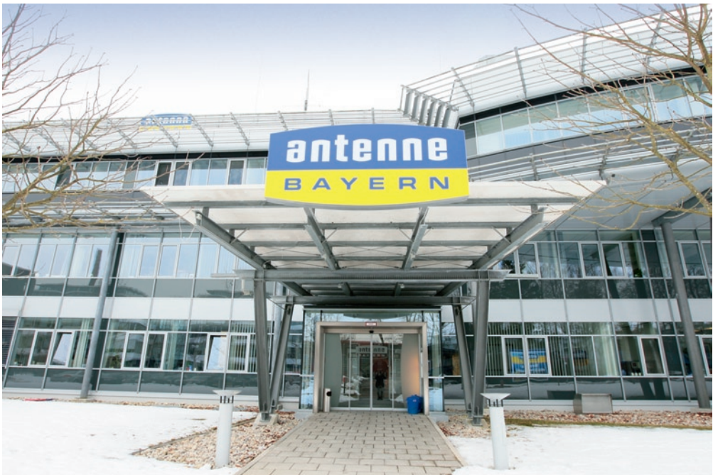
Abb. 1: Die Klimaanlage im neuen Gebäude von Antenne Bayern wurden bei laufendem Betrieb um ein VRF-Klimasystem mit Wärmerückgewinnung erweitert.

Im Beitrag wird der Einsatz eines redundanten VRF-Klimasystems als Wärmepumpe zum Heizen und Kühlen der Büros und Sendestudios von Antenne Bayern in Ismaning vorgestellt. Die Besonderheit der Anlage besteht in der zusätzlichen Wärmerückgewinnung durch die Nutzung der Server-Abwärme und die damit verbundene Unabhängigkeit von fossilen Brennstoffen.